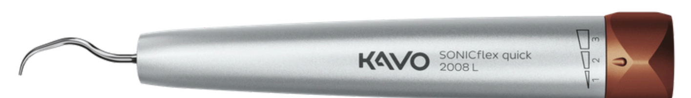
SONICflex quick Set 2008 L scaler sonico ora a 1.227€