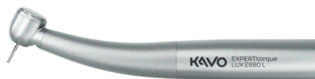
EXPERTtorque E680 L turbina ora a 620€